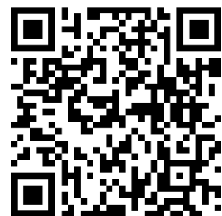
QR-code naar het tevredenheidsonderzoek

Wilt u meedoen met het tevredenheidsonderzoek na afloop van de werkzaamheden? Wij horen graag hoe tevreden u bent over onze communicatie en dienstverlening rondom de werkzaamheden. Het invullen van de enquête kost maximaal drie minuten en helpt ons onze dienstverlening te verbeteren. U kunt de enquête invullen door de QR-code hiernaast te scannen. Invullen kan tot 3 april.