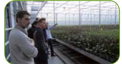
bedrijfsbezoek So Natural

Hoogeveen Plants heeft als gevolg van de masterclass de arbeidsregistratie nog verder uitgebouwd. Brand: 'We sturen nu nog meer op productiviteitscijfers. De masterclass heeft ons net wat extra scherpte opgeleverd waar we ons voordeel mee gaan doen.'